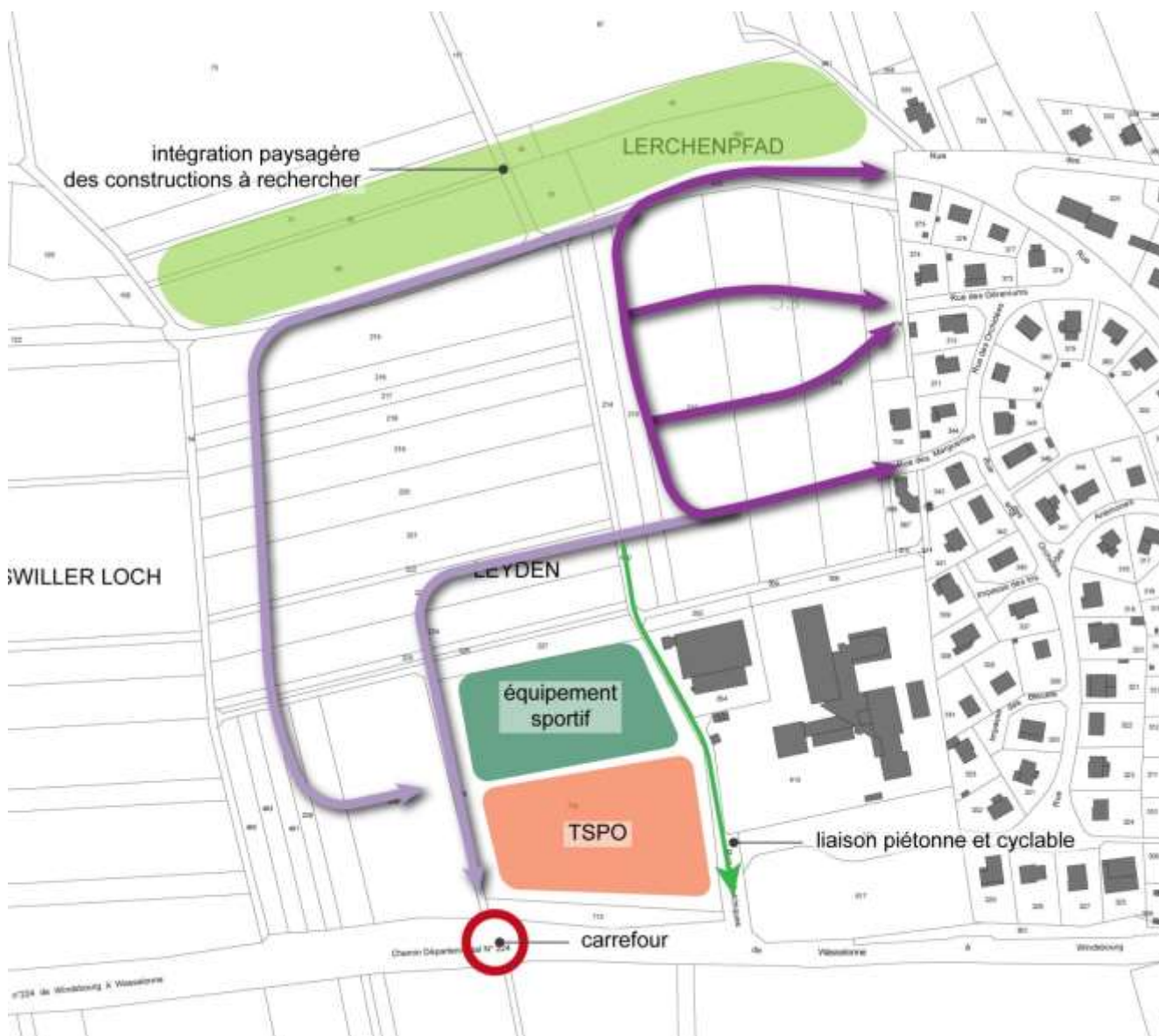
Schéma de principe d'organisation du quartier