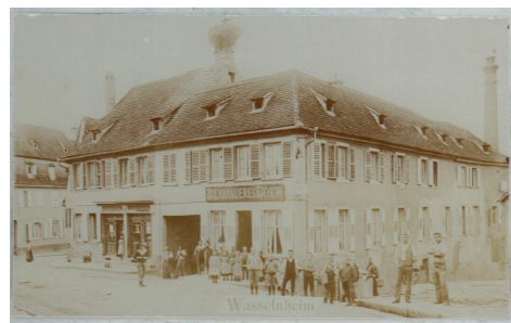
Brasserie Loew, restaurant Baer, actuel Magasin Peter.