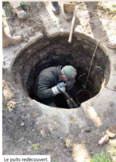
Le puits redécouvert.

Le même jour, prière du soir chantée à 20h à Traenheim.