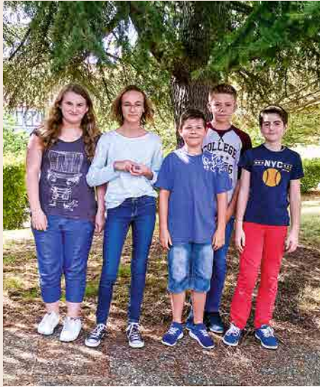
Les nouveaux catéchumènes de la paroisse Wangen-Marlenheim-Nordheim.