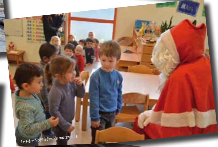
Le Père Noël à l'école maternelle