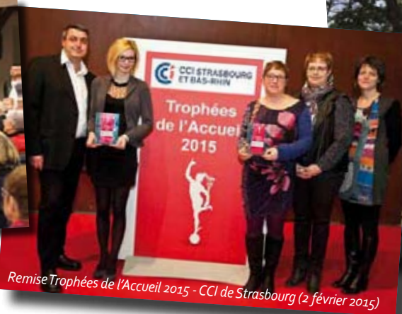
Remise Trophées de l'Accueil 2015 - CCI de Strasbourg (2 février 2015)

Vous reconnaîtrez les enseignes adhérentes grâce à une communication commune clairement identifiable avec le logo ASCA décliné sur les vitrines, dans les dépliants et les campagnes de publicité.