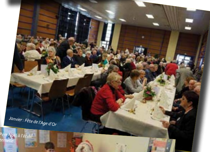
Janvier : Fête de l'Age d'Or