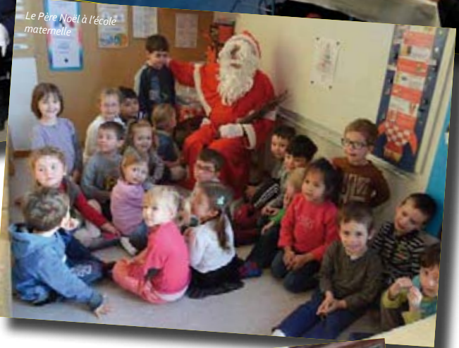
Le Père Noël à l'école maternelle