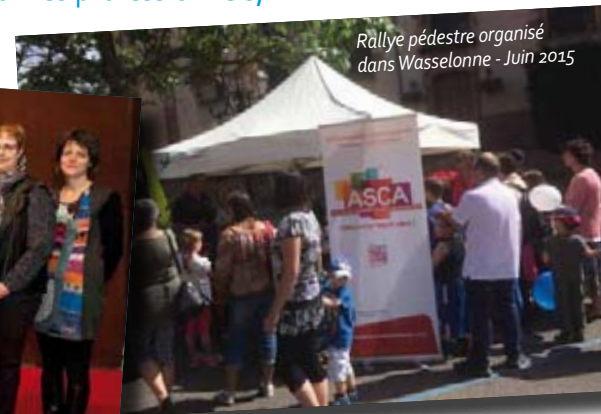
Rallye pédestre organisé dans Wasselonne - Juin 2015

Depuis quelques mois, un événement se prépare : l'ASCA organise une course de caisses à savon dans les rues de Wasselonne les 14 et 15 mai prochains. Pour en savoir plus, renseignez-vous chez vos commerçants et artisans ou venez à la réunion d'information du mercredi 24 février (voir ci-dessous).