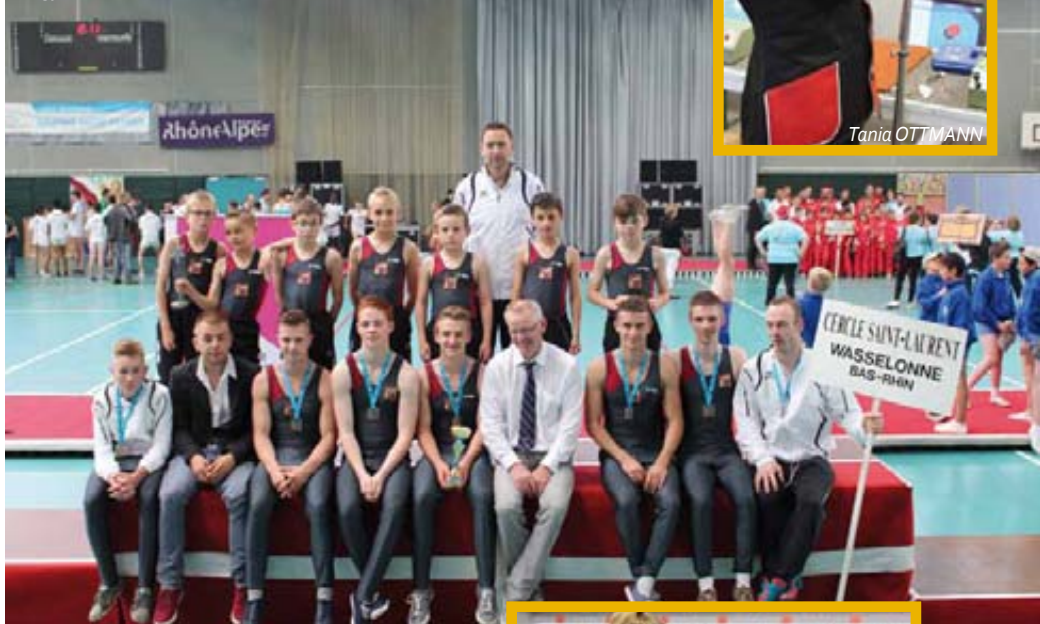
Les gymnastes aux Championnats de France à La Motte Servolex