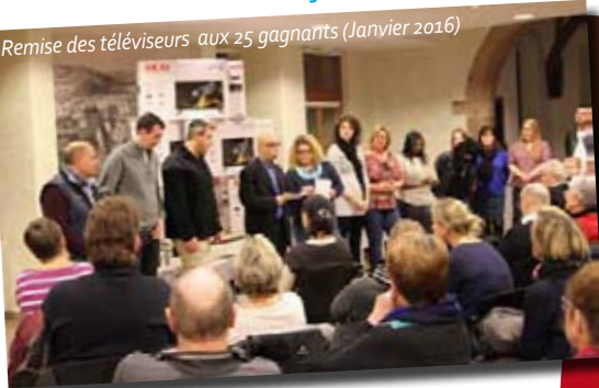
Remise des téléviseurs aux 25 gagnants (Janvier 2016)

En additionnant les talents de ses membres et en multipliant les événements, l'ASCA met en valeur les compétences des professionnels du secteur et offre à sa clientèle des produits et des services de qualité.