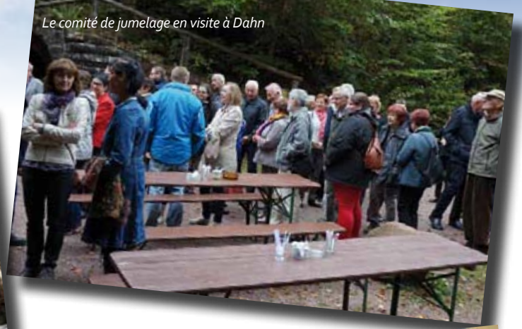
Le comité de jumelage en visite à Dahn