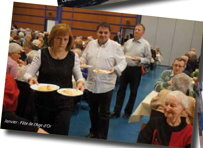
Janvier : Fête de l'Age d'Or