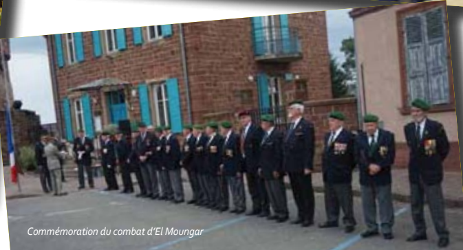
Commemoration du combat d'El Mungar