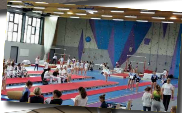
5 Juin 2016 - Championnat Régional en Section organisé par le Cercle Saint Laurent au nouveau complexe sportif