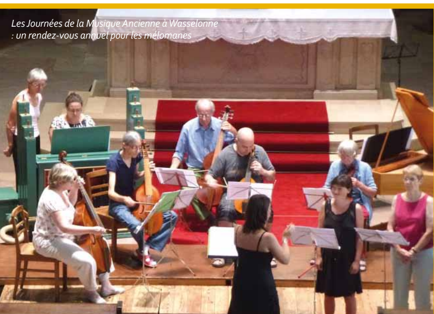
Les Journées de la Musique Ancienne à Wasselonne : un rendez-vous annuel pour les mélomanes