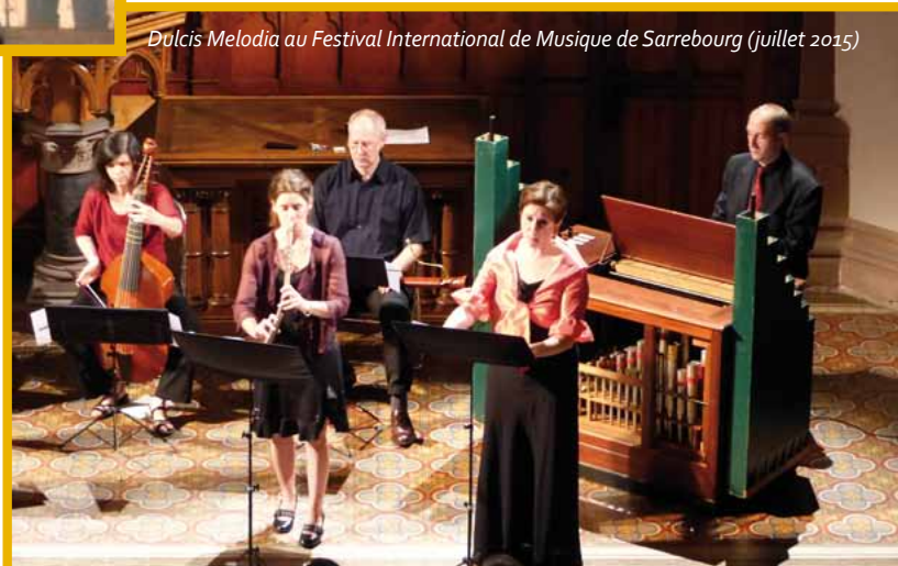
Dulcis Melodia au Festival International de Musique de Sarrebourg (juillet 2015)

Une autre particularité de la formation wasselonnaise est la diversité des activités menées : à côté des concerts produits dans la région mais également dans le reste de la France et en Allemagne, Dulcis Melodia s'investit beaucoup dans la pédagogie. Des interventions en milieu scolaire permettent aux plus jeunes de découvrir notre riche patrimoine musical (Dulcis Melodia anime notamment depuis 2014 un atelier de T.A.P. à l'école Paul Fort) tandis qu'un stage estival réunit chaque année à Wasselonne une vingtaine d'adultes amateurs venus de divers horizons pour quatre jours autour d'un projet musical.