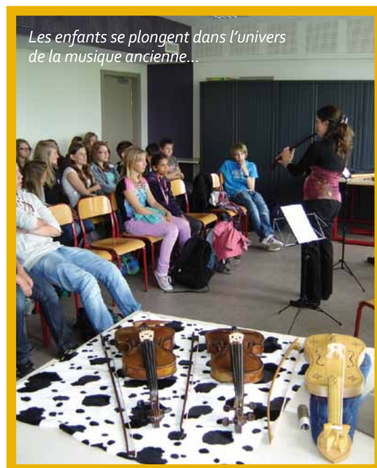
Les enfants se plongent dans l'univers de la musique ancienne...

Créé en 2007, l'ensemble Dulcis Melodia rassemble des musiciens professionnels passionnés par le répertoire baroque.