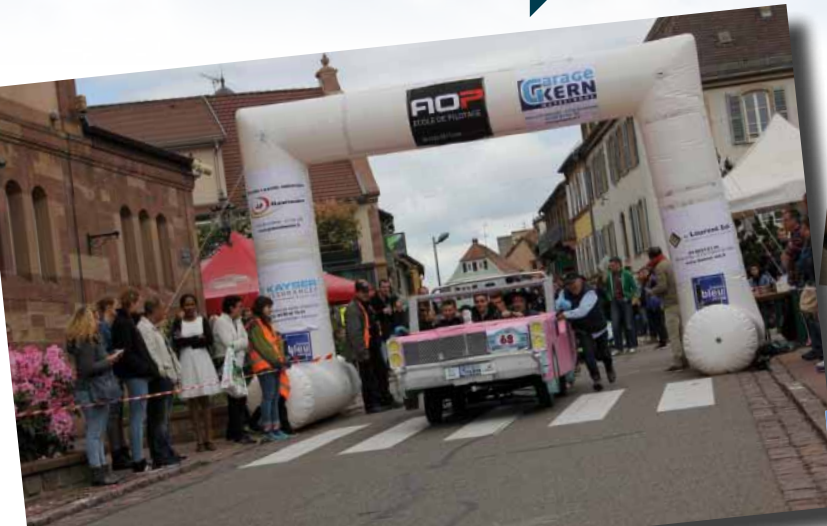
Course de caisses à savon Mai 2016