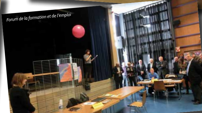
Forum de la formation et de l'emploi