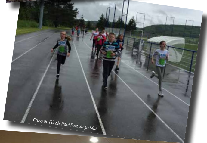
Cross de l'école Paul Fort du 30 Mai