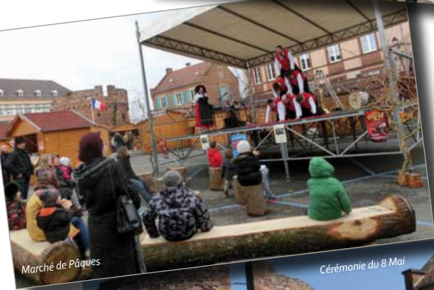
Marché de Pâques