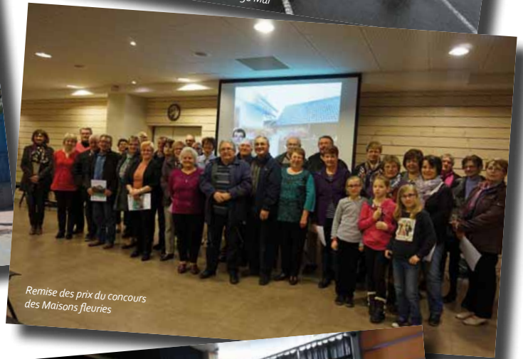
Remise des prix du concours des Maisons fleuries