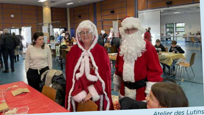
Atelier des Lutins