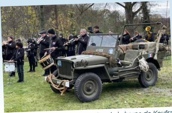
Inauguration de la borne de Koufra