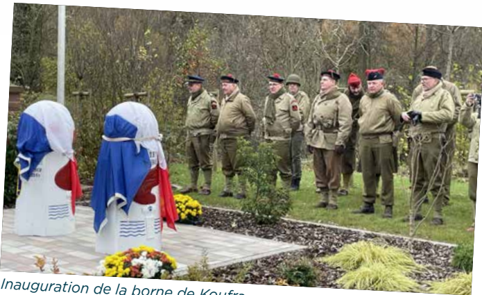
Inauguration de la borne de Koufra