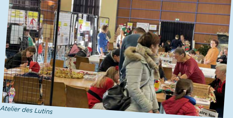
Atelier des Lutins