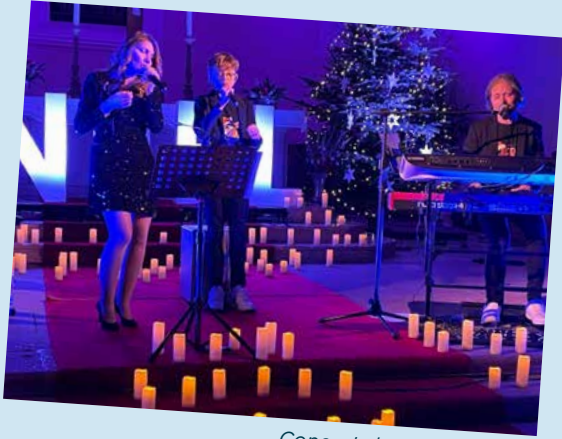
Concert de Noël