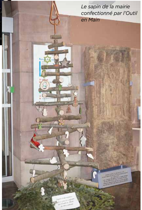
Le sapin de la mairie confectionné par l'Outil en Main