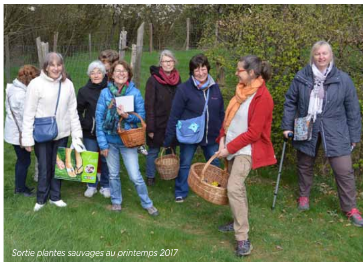
Sortie plantes sauvages au printemps 2017

La bibliothèque dispose aussi d'un fonds important de livres pour enfants en langue allemande, en lien avec les sites bilingues des écoles Jean Cocteau et Paul Fort. La proximité avec le groupe scolaire est d'ailleurs mise en avant par l'équipe de la bibliothèque, qui participe également aux TAP organisés par la ville après l'école et reçoit chaque semaine des enfants du périscolaire.