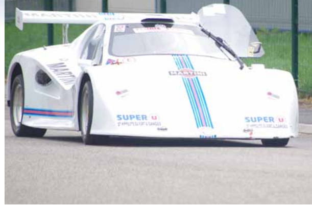
Slalom de Wasselonne