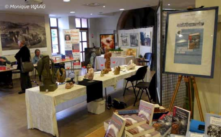
Salon des Artistes