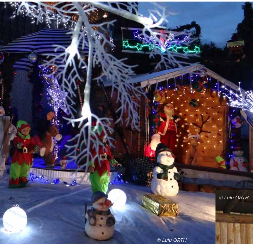
Maison de Noël