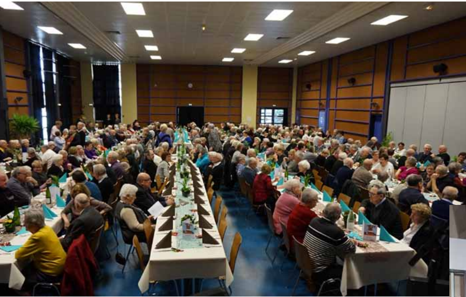
Fête de l'Age d'Or