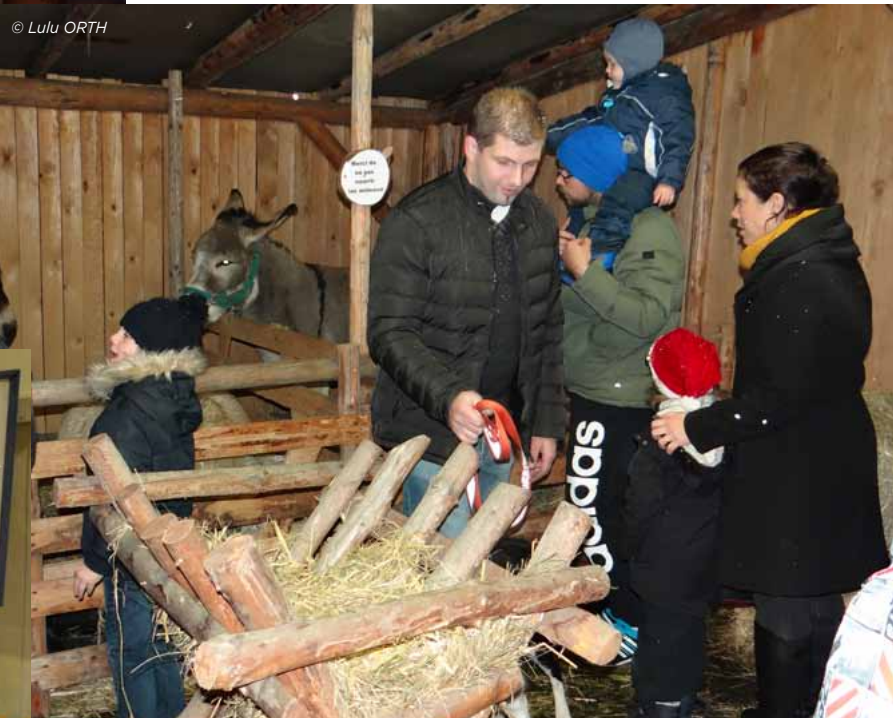
Noël au Château