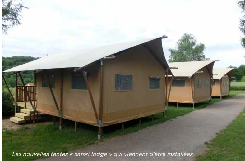
Les nouvelles tentes « safari lodge » qui viennent d'être installées