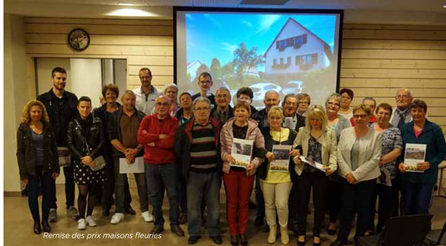
Remise des prix maisons fleuries