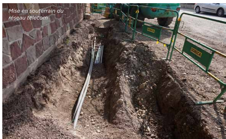
Mise en souterrain du réseau telecom