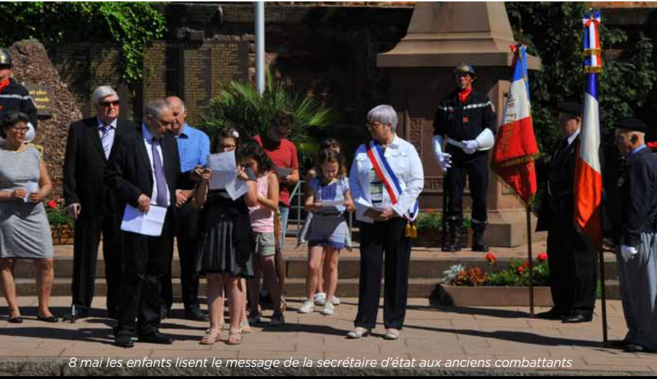
8 mai les enfants lisent le message de la secrétaire d'état aux anciens combattants