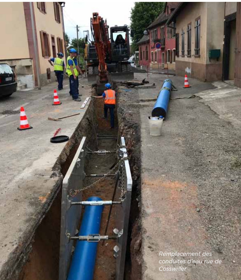
Remplacement des conduites d'eau rue de Cosswiller