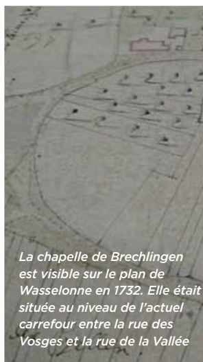
La chapelle de Brechlingen est visible sur le plan de Wasselonne en 1732. Elle était située au niveau de l'actuel carrefour entre la rue des Vosges et la rue de la Vallée

Une autre chapelle, dont le Patron (7) n'est pas connu, se trouvait à Brechlingen. La commune en disposa en l'année 1568 comme