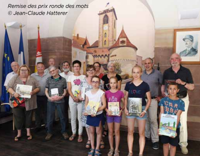
Remise des prix ronde des mots