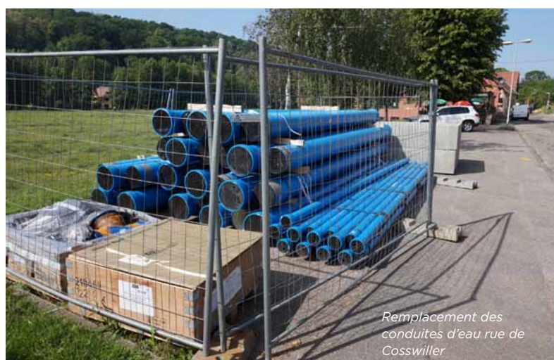
Remplacement des conduites d'eau rue de Cosswiller

Rue Osterfeld : les réseaux d'eau et d'assainissement ont été remplacés et renforcés. En ce moment, les entreprises procèdent à la mise en souterrain du réseau de téléphone. Ensuite, la voirie sera entièrement refaite pour rendre cette rue à ses habitants. Un giratoire sera créé à l'intersection de la rue Osterfeld et de la rue Berlioz.