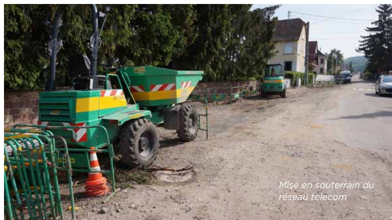
Mise en souterrain du réseau telecom