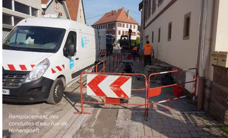
Remplacement des conduites d'eau rue de Hohengoelt