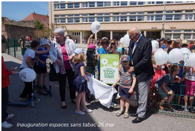
Inauguration espaces sans tabac 25 mai