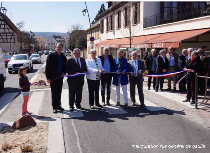
Inauguration rue général de gaulle