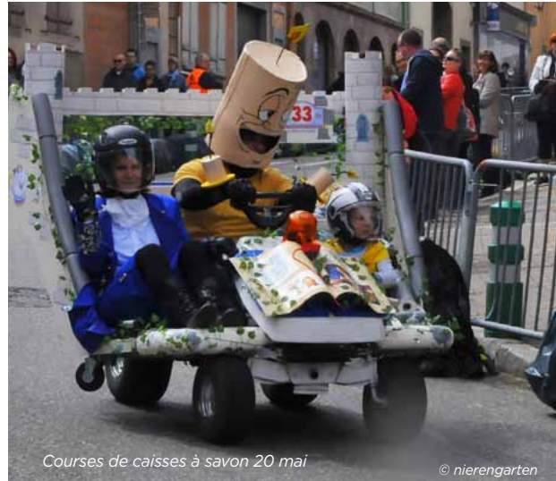
Courses de caisses à savon 20 mai