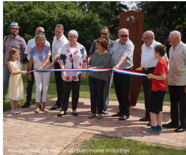
Inauguration du sentier du patrimoine industriel