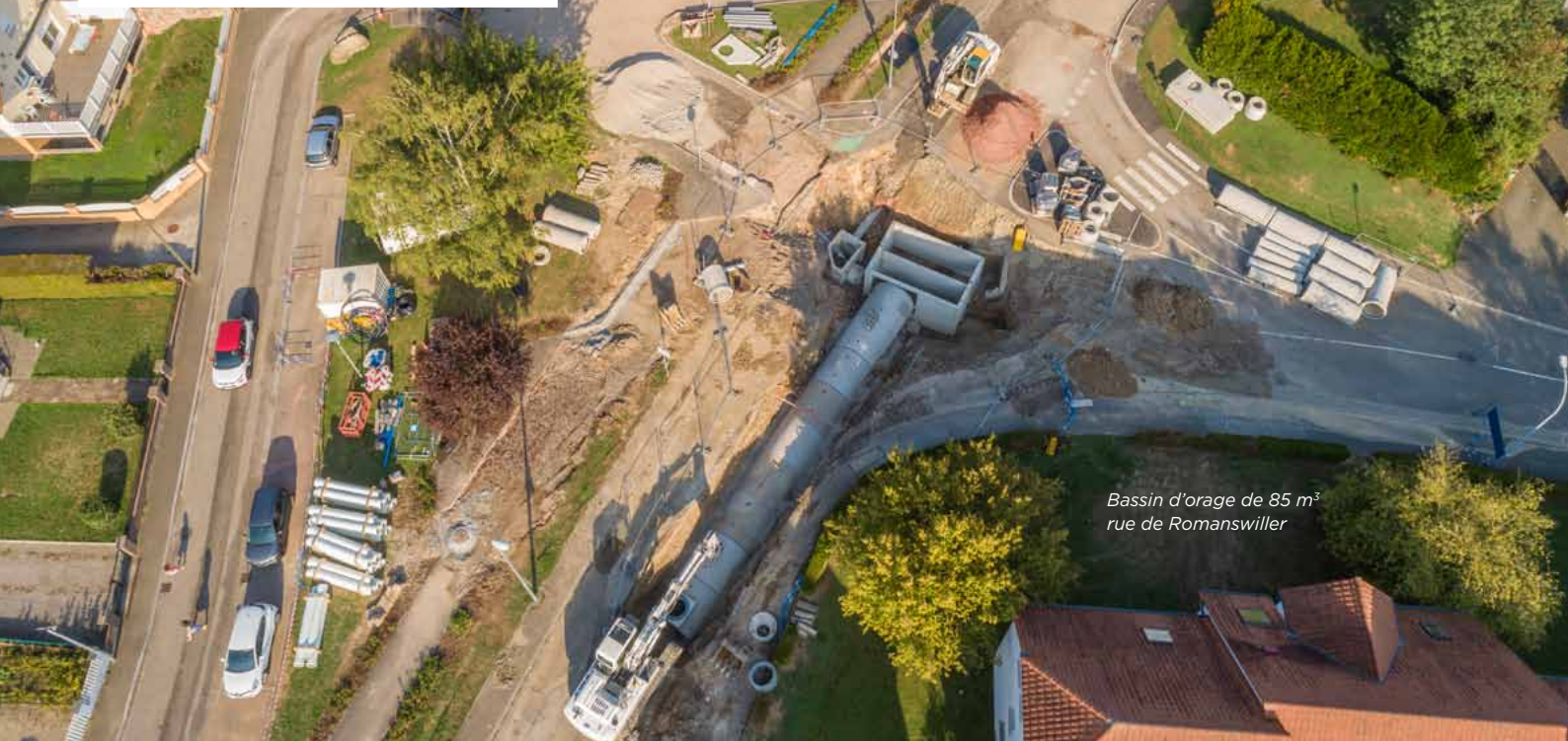
Bassin d'orage de 85 m 3 rue de Romanswiller

Une conduite « eau pluviale » a été posée en attente et sera prolongée vers la rue des Glâieuls en 2019. Elle collectera les eaux de pluie de voirie, une partie des eaux de pluie du lotissement « Les Champs Fleuris » et servira d'exutoire aux aménagements « coulées de boue » prévus en amont du lotissement Bubenstein.