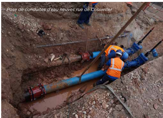
Pose de conduites d'eau neuves rue de Cosswiller

Rue des Muguets: un nouveau tapis d'enrobé sera posé dans cette rue. La conduite d'eau y a également été renouvelée.