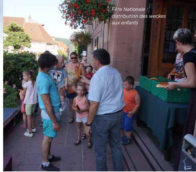
Fête Nationale : distribution des weckes aux enfants