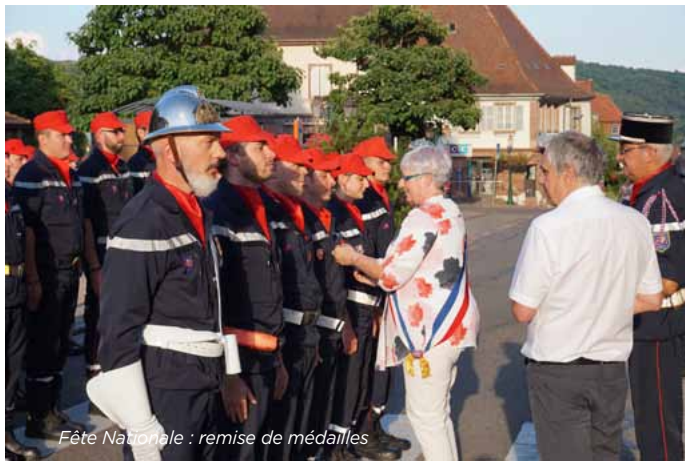
Fête Nationale : remise de médailles