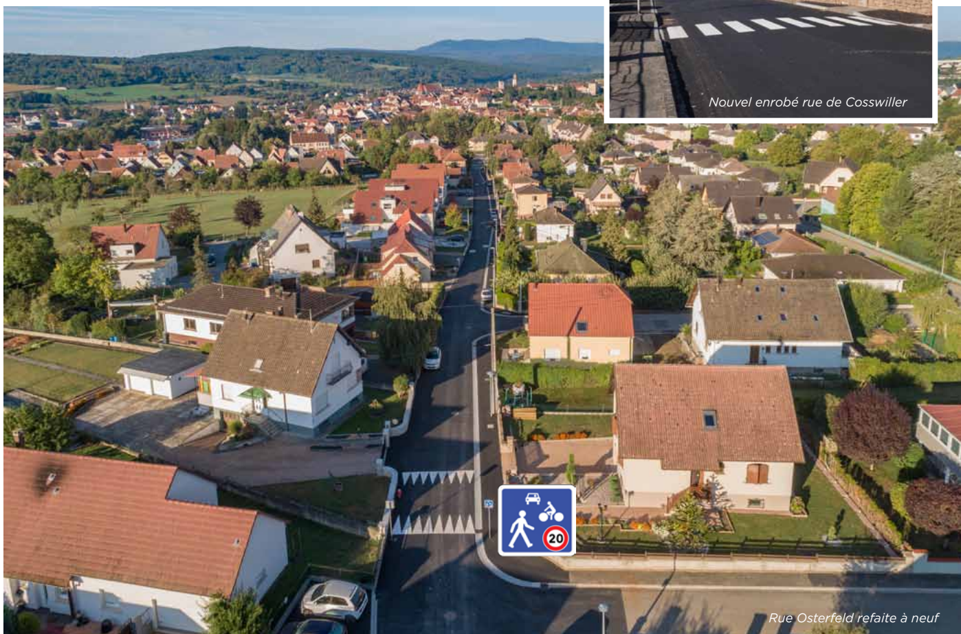
Pose du tapis d'enrobés rue Osterfeld