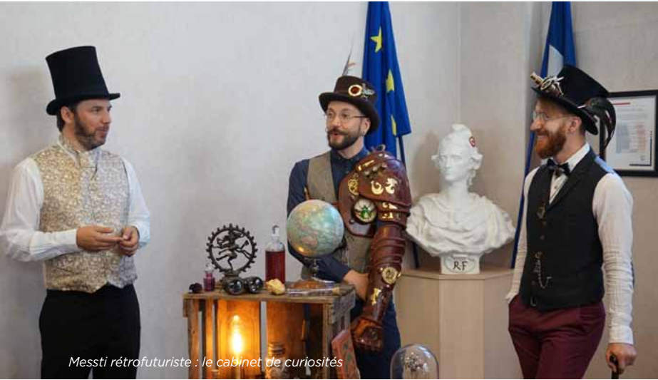
Messti rétrofuturiste : le cabinet de curiosités