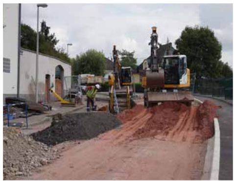
Pose de réseau assainissement rue de Romanswiller à près de 4 m de profondeur