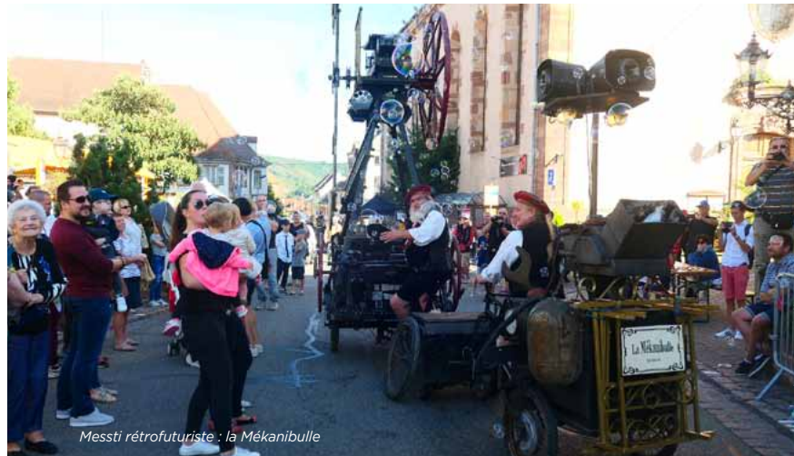
Messti rétrofuturiste : la Mékanibulle