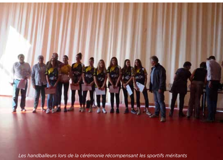
Les handballeurs lors de la cérémonie récompensant les sportifs méritants