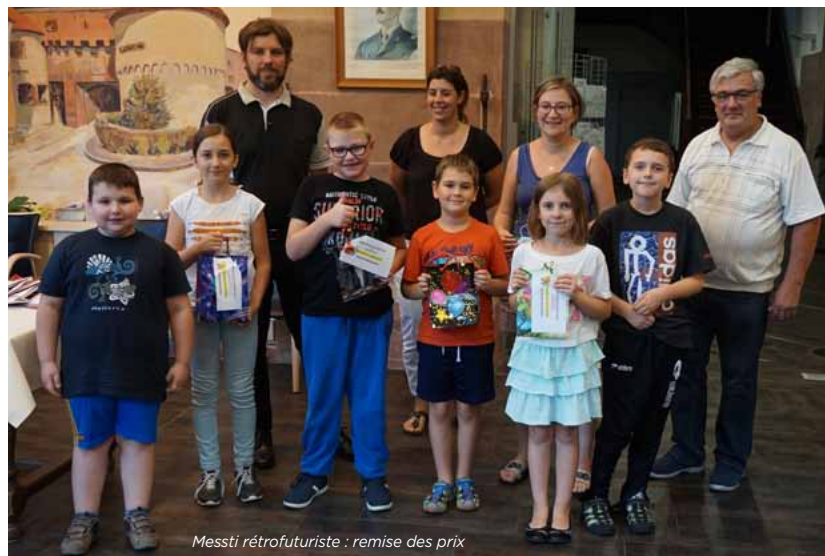
Messti rétrofuturiste : remise des prix