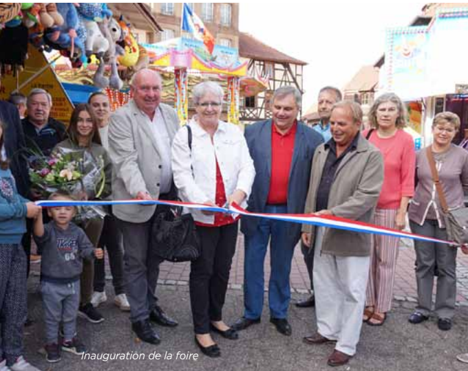
Inauguration de la foire