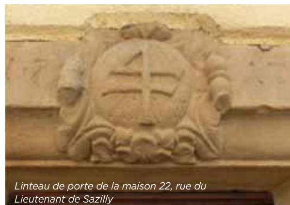
Linteau de porte de la maison 22, rue du Lieutenant de Sazilly

Source : Jean-Jacques Waltz (Hansi), L'art héraldique en Alsace , Berger-Levrault - Nancy, 1975.