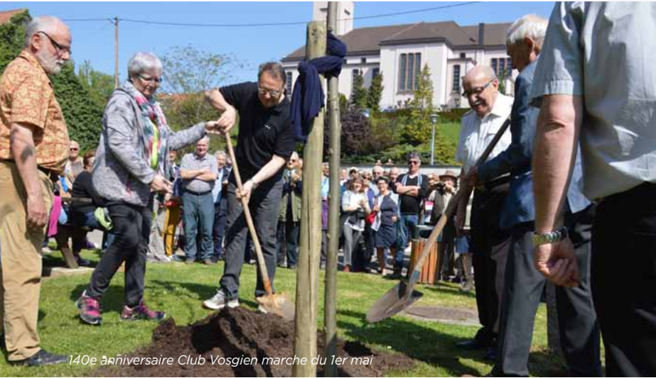
140e anniversaire Club Vosgien marche du 1er mai