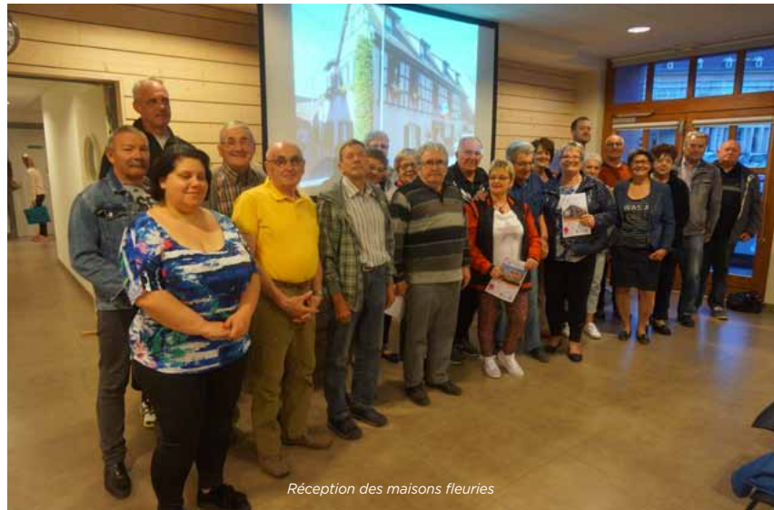
Réception des maisons fleuries