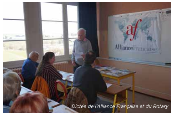
Dictée de l'Alliance Française et du Rotary