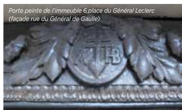
Porte peinte de l'immeuble 6, place du Général Leclerc (façade rue du Général de Gaulle)