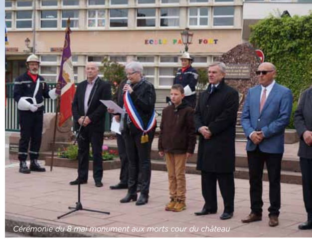
Cérémonie du 8 mai monument aux morts cour du château