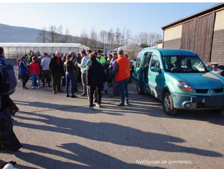
Nettoyage de printemps