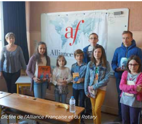
Dictée de l'Alliance Française et du Rotary