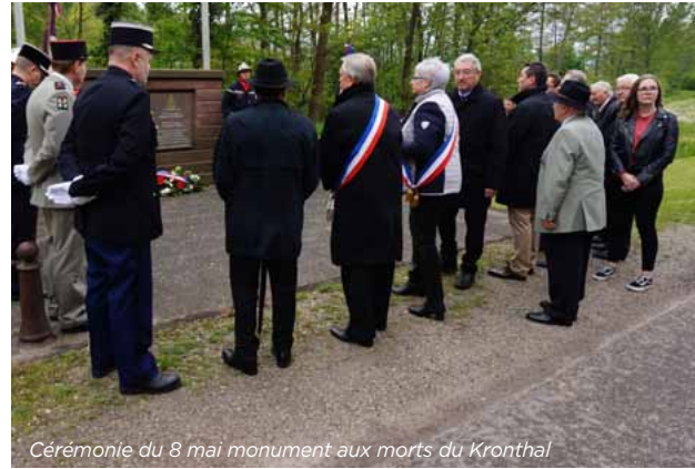
Cérémonie du 8 mai monument aux morts du Kronthal