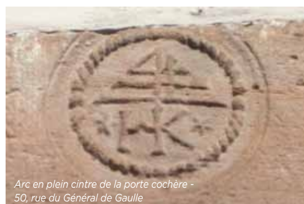
Arc en plein cintre de la porte cochère - 50, rue du Général de Gaulle