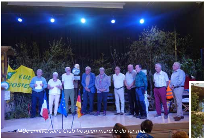
140e anniversaire Club Vosgien marche du 1er mai