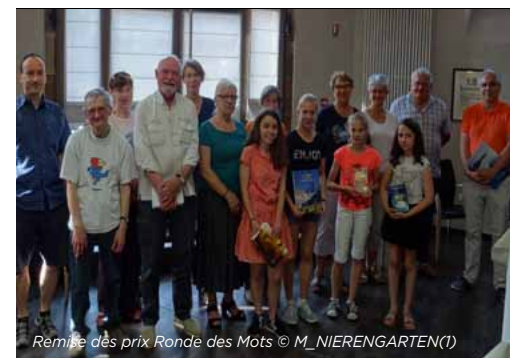
Rémission des prix Ronde des Mots