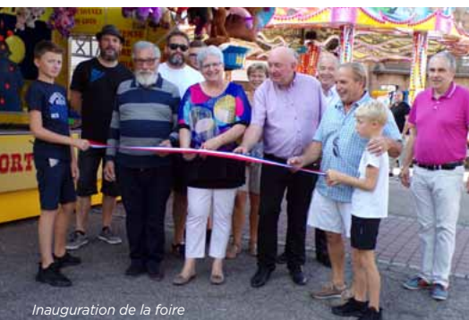
Inauguration de la foire