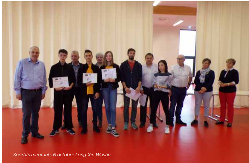
Sportifs méritants 6 octobre Long Xin Wushu