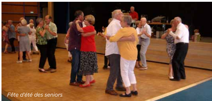
Fête d'été des seniors