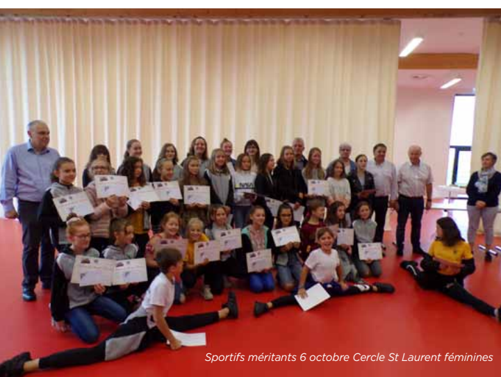
Sportifs méritants 6 octobre Cercle St Laurent féminines