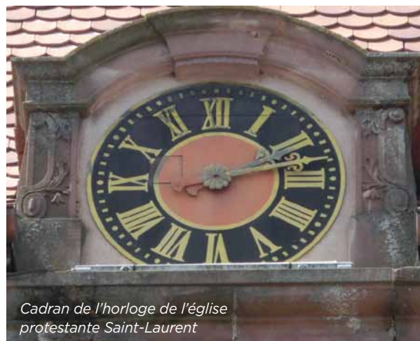
Cadran de l'horloge de l'église protestante Saint-Laurent