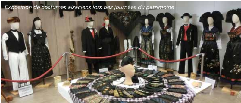
Exposition de costumes alsaciens lors des journées du patrimoine