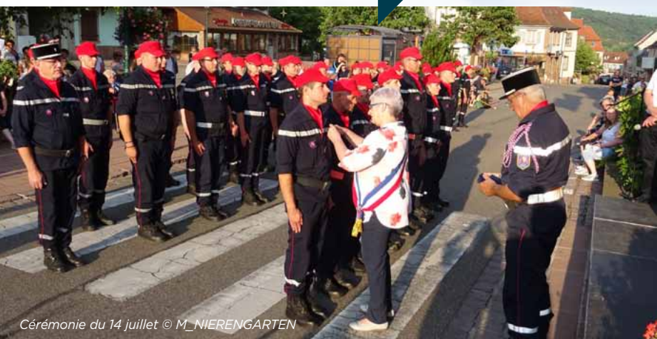
Cérémonie du 14 juillet