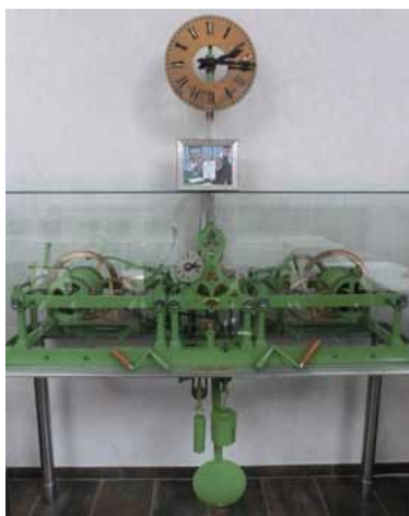
Mécanisme de l'horloge fabriqué à Strasbourg en 1840 par l'entreprise Schwilgué (1)