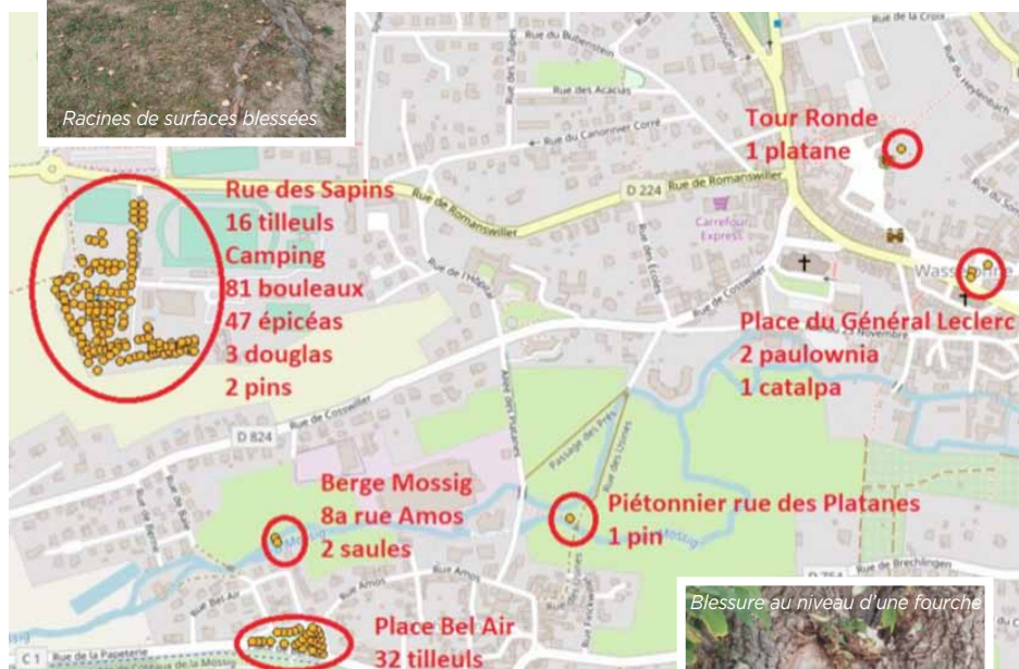
Situation de l'étude