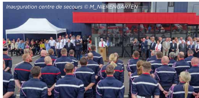
Inauguration centre de secours