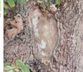
Blessure au niveau d'une fourche