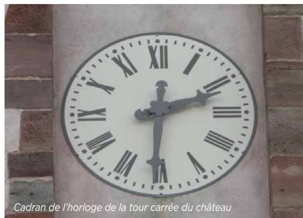
Cadran de l'horloge de la tour carrée du château