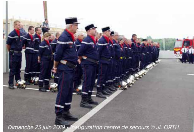
Dimanche 23 juin 2019 - Inauguration centre de secours