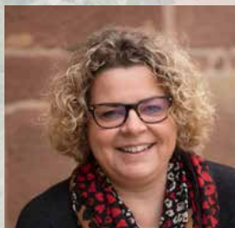
ADJOINTE AU MAIRE EN CHARGE DE LA COMMUNICATION