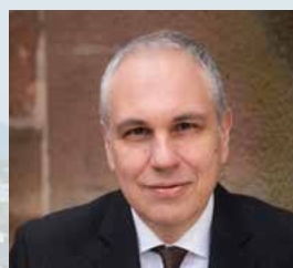
1 ER ADJOINT AU MAIRE EN CHARGE DE L'ATTRACTIVITÉ DE LA VILLE ET DE L'URBANISME