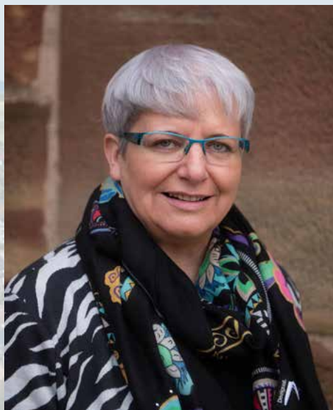
MAIRE DE WASSELONNE

Le conseil municipal est maintenant installé. Dès demain, nous pourrons naturellement construire ensemble, municipalité, habitants et forces vives, l'avenir de Wasselonne. Il se fera dans le respect de nos engagements électoraux.