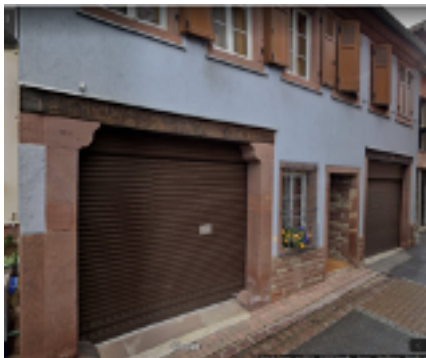
14, cour du Château Grange Provot transformée en logement