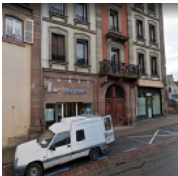
65, rue du Général de Gaulle Façade de la maison Provot.