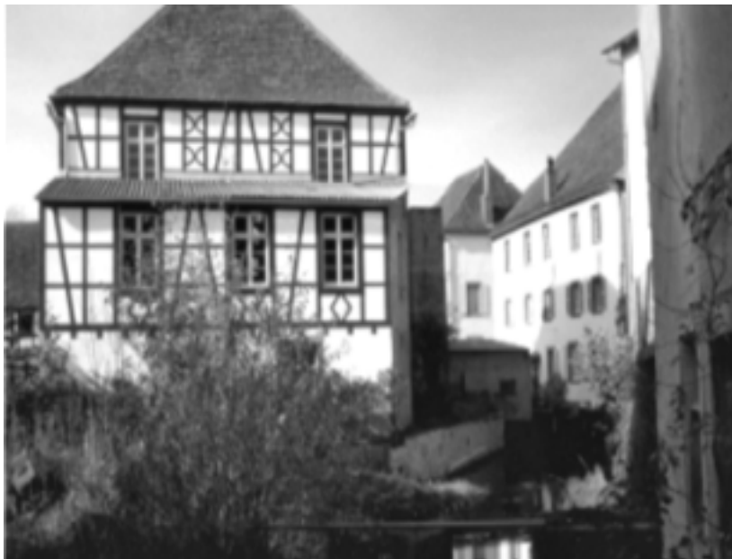
Ancien moulin à farine Seyter. 1828, fabrique de chaussons de laine AMOS.