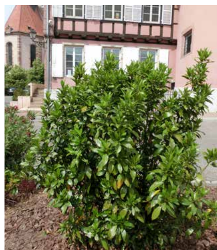
Le laurier-sauce de la Place du Marché (à ne pas confondre avec le laurier rose ou à fleurs à proximité qui lui est toxique)