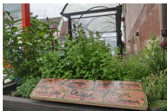
Petit bac d'aromatiques du côté de l'église protestante

Pour s'inscrire il suffit d'envoyer un message avec ses coordonnées à : developpement.durable@wasselonne.org