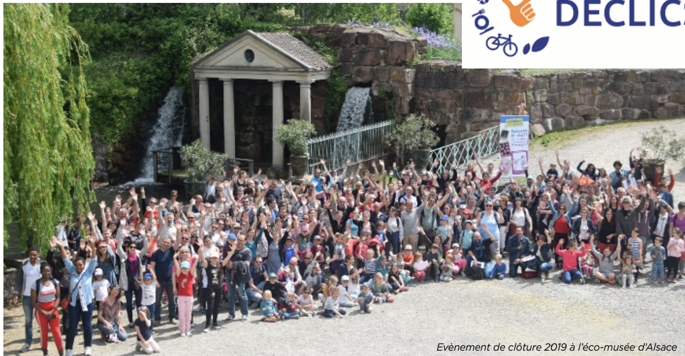
Evènement de clôture 2019 à l'éco-musée d'Alsace

C'est un défi d'économies d'énergie et de réduction des déchets qui se déroulera du 1 er novembre 2020 au 30 avril 2021. La mission des familles participantes consiste à réduire leur consommation d'énergie et d'eau d'au moins 8% et de déchet d'au moins 20% en réalisant des éco-gestes peu connus, et sans perdre en confort de vie.