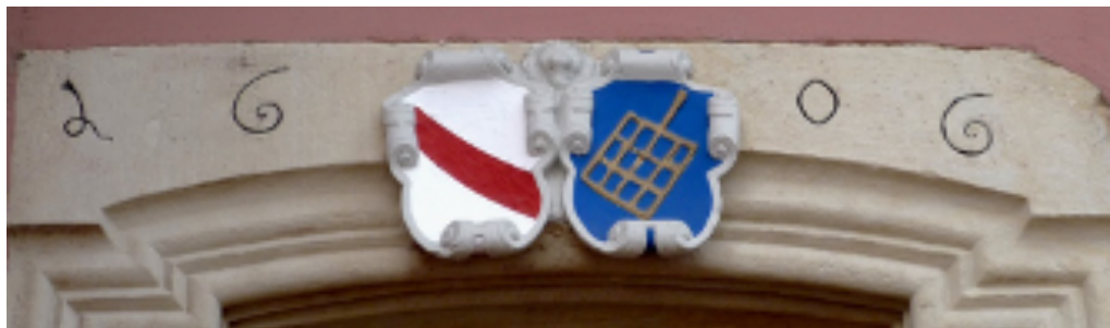
Blason simplifié : gril posé en barre.