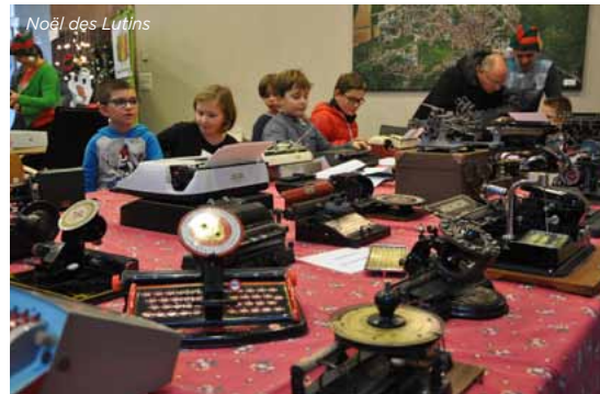
Noël des Lutins