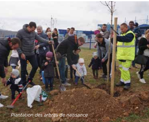
Plantation des arbres de naissance