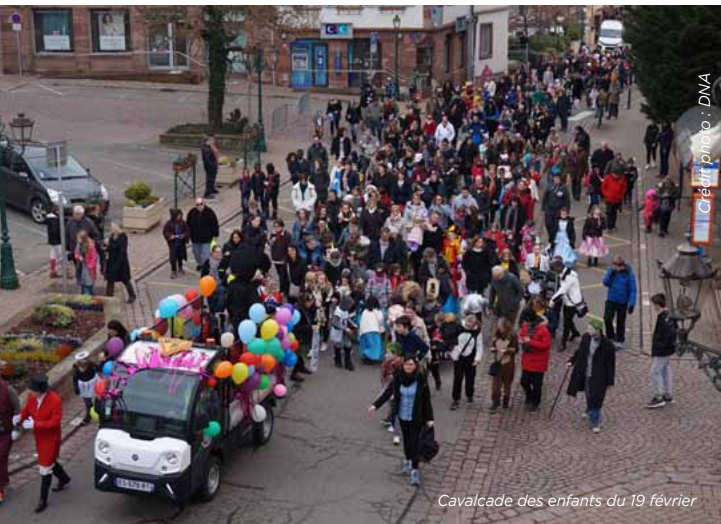
Cavalcade des enfants du 19 février