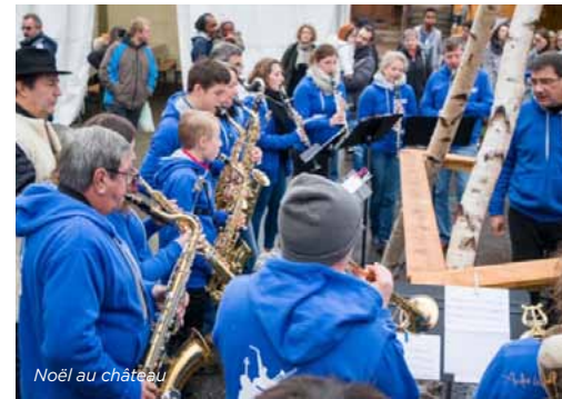
Noël au château