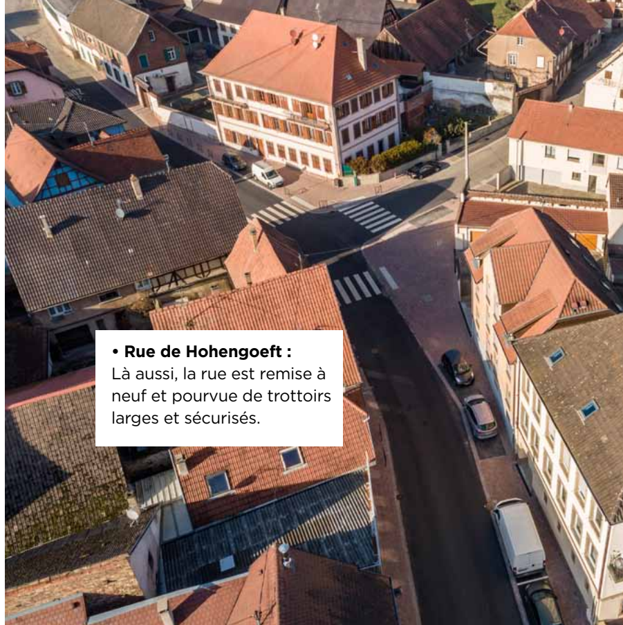
• Rue de Hohengoett : Là aussi, la rue est remise à neuf et pourvue de trottoirs larges et sécurisés.