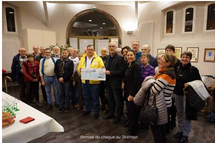
Remise du chèque au Téléthon