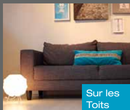
Sur les Toits