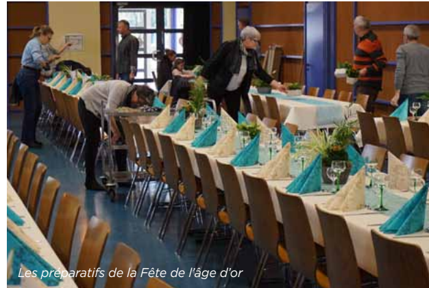
Les préparatifs de la Fête de l'âge d'or