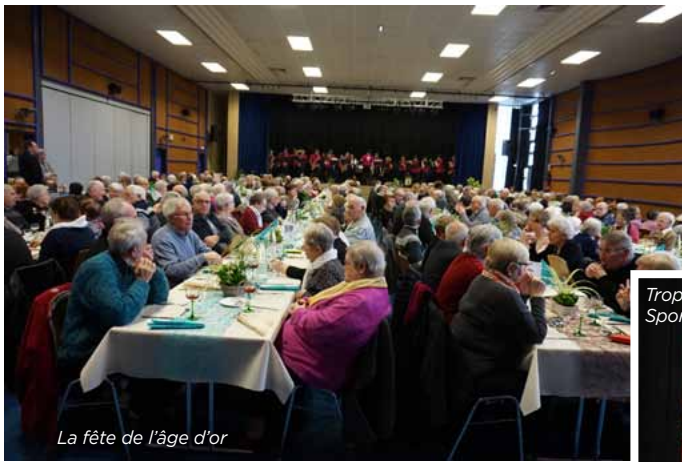
La fête de l'âge d'or