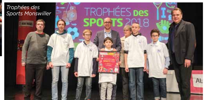
Trophées des Sports Monswiller