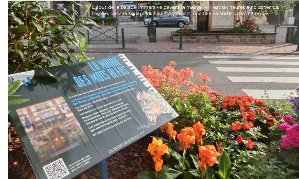
Début de la balade immersive devant la mairie : « Il est six heures au clocher de l'église, dans le square les fleurs poétisent, une fille va sortir de la mairie... »

Cette année, le fleurissement estival de Wasselonne est inspiré par Les Mots Bleus, célèbre chanson de Christophe, avec le bleu comme dominante. Mais d'une simple idée de couleur, ce projet est devenu un hommage, en cette période de pandémie, à Christophe, disparu le 16 avril 2020, ainsi qu'à toutes les autres victimes de la Covid-19, et à celles et ceux qui combattent ce mal et ont l'espoir de voir enfin le bout du tunnel.