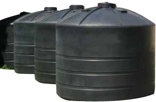
Les réservoirs, avant leur installation