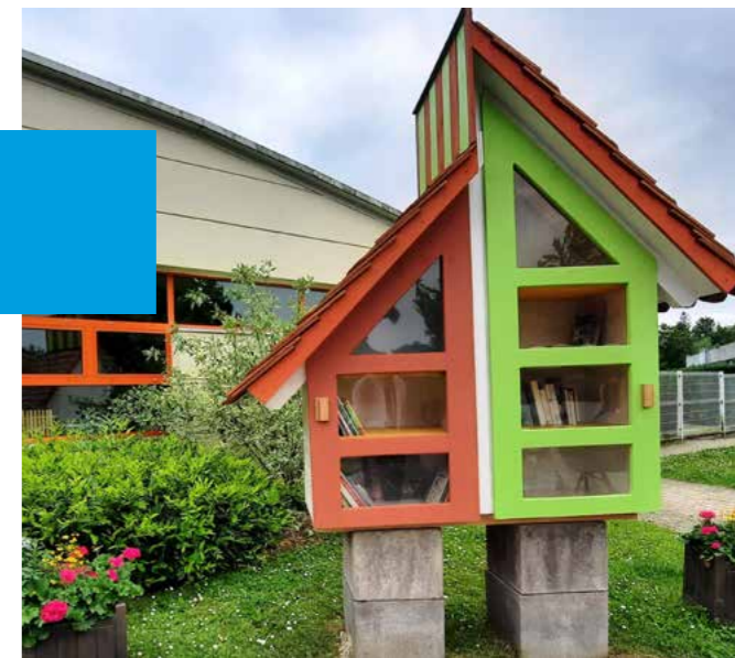
La boîte à livres située près de l'école Paul Eluard