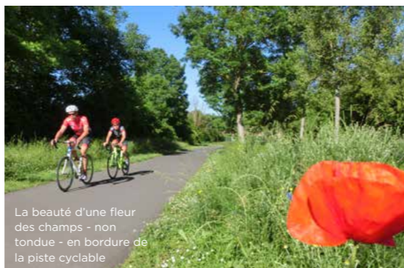
La beauté d'une fleur des champs - non tondue - en bordure de la piste cyclable

Le cycle de l'eau est aujourd'hui intégralement affecté par le dérèglement climatique : perturbation des régimes pluviométriques, du ruissellement, du niveau des mers... Ces changements ont de fortes répercussions sur les milieux aquatiques, ainsi que sur l'ensemble de