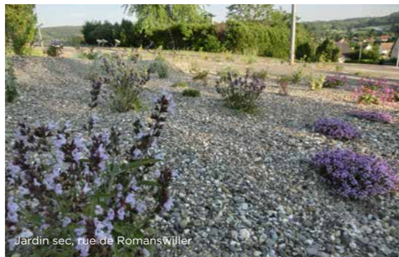
Jardin sec, rue de Romanswiller

Parallèlement, une réflexion est menée pour supprimer certains points de fleurissement excentrés et peu visibles, toujours dans l'optique de diminuer la quantité d'eau utilisée pour l'arrosage mais également de limiter les déplacements des agents.