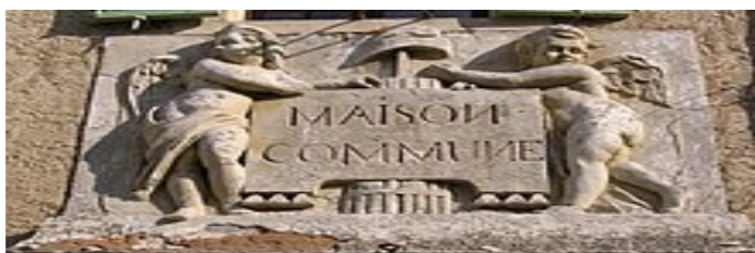
Maison commune de Saint-Saturnin-lès-Apt (Vaucluse)