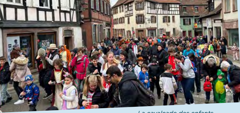
La cavalcade des enfants