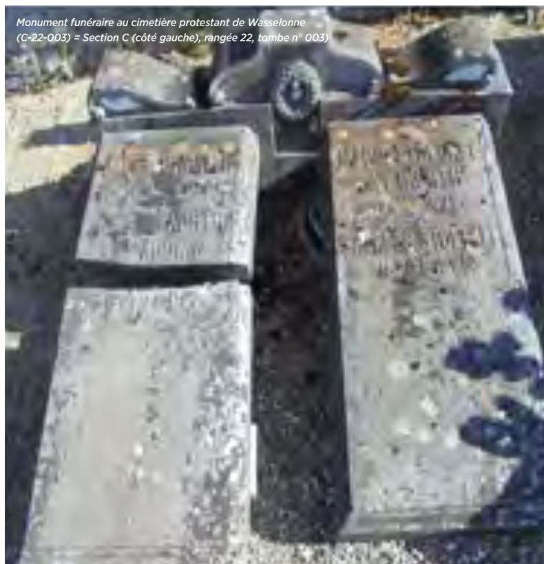
Monument funéraire au cimetière protestant de Wasselonne (C-22-003) = Section C (côté gauche), rangée 22, tombe n° 003