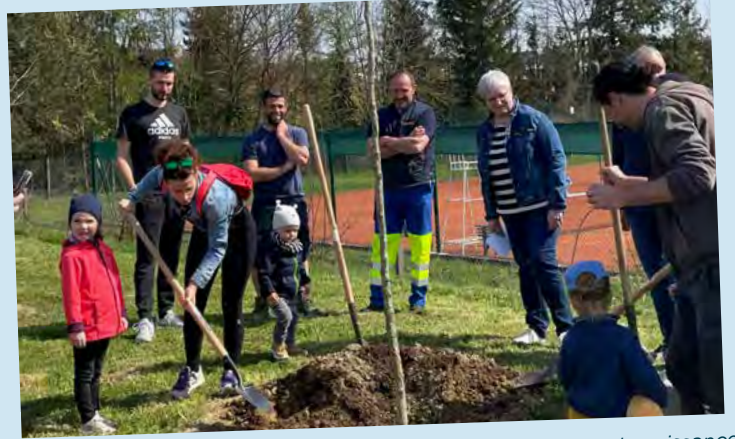
Plantation des arbres de naissance