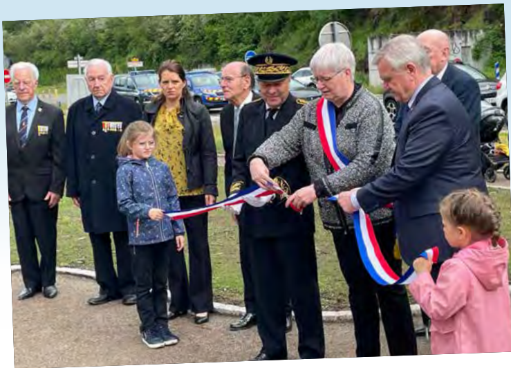
Inauguration de la stèle sur la RD1004