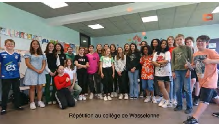
Répétition au collège de Wasselonne

La CeA voulait engager 26 collèges alsaciens à la rencontre de 26 groupes d'écoliers des autres pays européens.