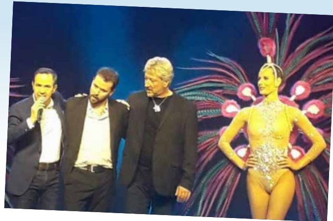
La soirée cabaret