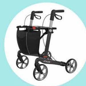
Déambulateur et Rollator