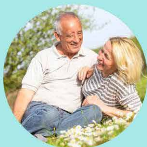
Protections, Confort Bien-être

Conventionné avec la Caisse d'Assurance Maladie. Nous acceptons les cartes Vitale Santé et nous pratiquons le tiers-payant.