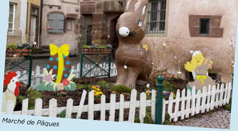
Marché de Pâques