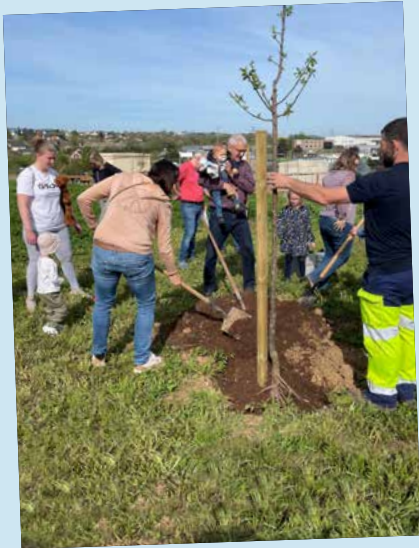
Plantation des arbres de naissance