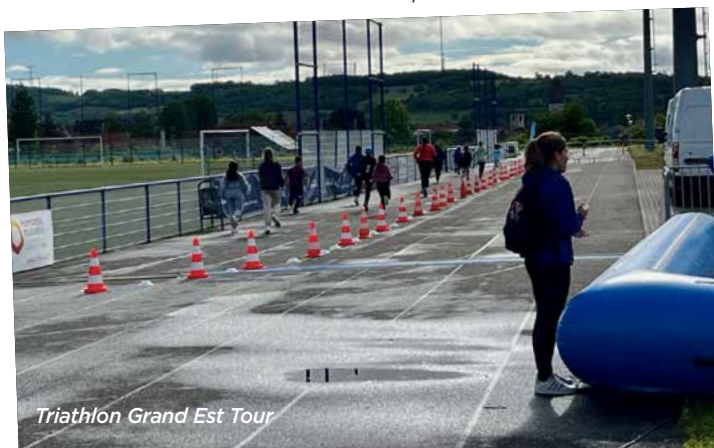
Triathlon Grand Est Tour