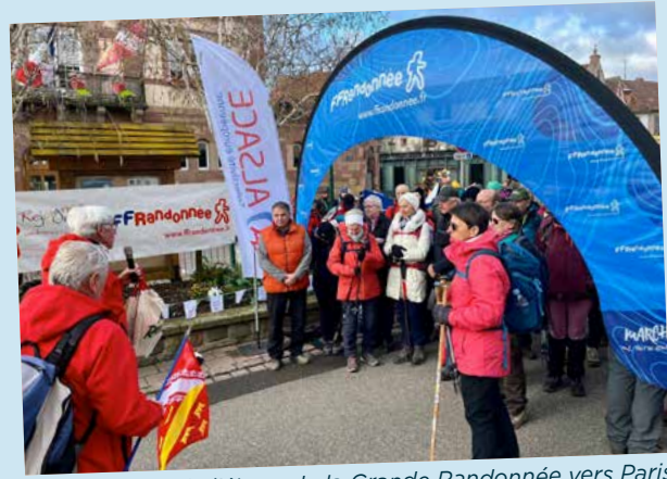
Départ de l'étape de la Grande Randonnée vers Paris