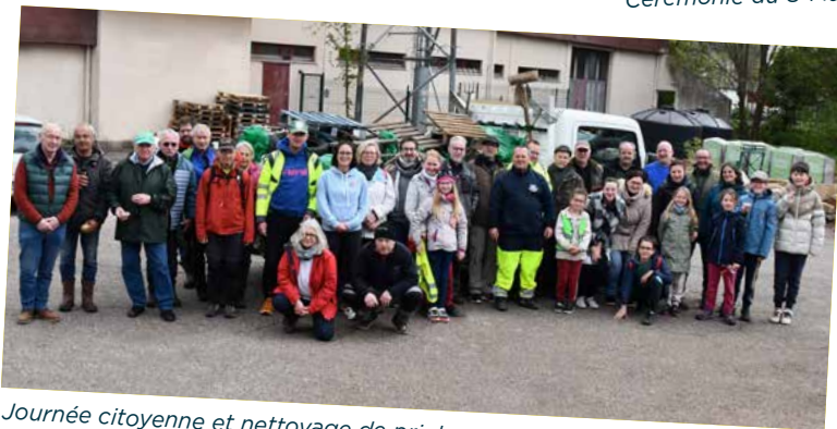
Journée citoyenne et nettoyage de printemps