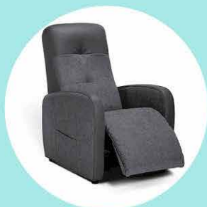
Fauteuils Releveurs et Relax