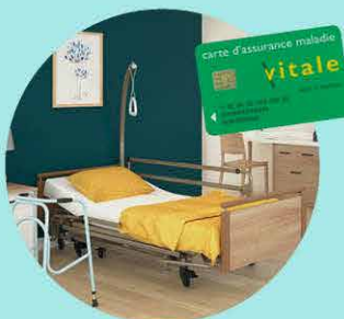
Location de lit médicalisé