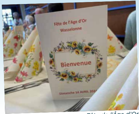
Fête de l'Âge d'Or