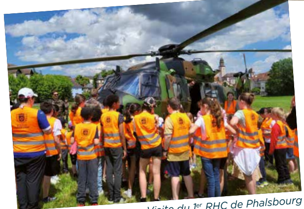
Visite du 1er RHC de Phalsbourg